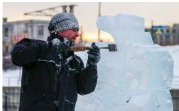
Images 5 : Activités du carnaval d'hiver 2016. À gauche, jeux gonflables. À droite, sculpture sur glace.

Depuis la session 2017, des feux d'artifices sont tirés au bord du canal Lachine ! Cette dernière édition a vu un énorme succès auprès des citoyens du quartier et dans les médias sociaux. Le maire de l'arrondissement, M. Benoît Dorais, nous a même fait bénéficier de sa présence !